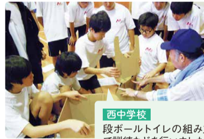
西中学校 段ボールトイレの組み立て訓練などを行いました。