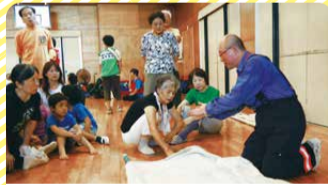
一本松小学校 簡易担架の組立て 拠点にあるポールと毛布で簡易担架を作り、けが人などの搬送に使用します。