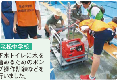
老松中学校 下水トイレに水を溜めるためのポンプ操作訓練などを行いました。

中学生が大活躍！ 仮設トイレの組立や調理補助、避難者受付など、さまざまな訓練を大人と一緒に体験しました。