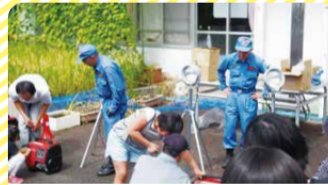
西前小学校 投光器訓練 避難所の明かり用に、発電機を始動させて投光器をつなげる訓練を行いました。