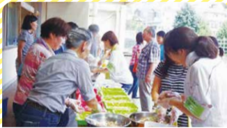
東小学校 炊き出し訓練 避難者の食事の支度で10kg以上のお米を一度に炊いておにぎりにします。