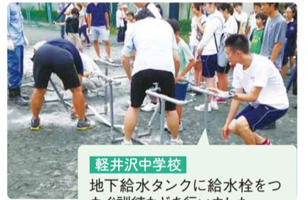
軽井沢中学校 地下給水タンクに給水栓をつなぐ訓練などを行いました。