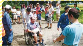
浅間台小学校 車イス体験 拠点には自力歩行が難しい人も避難して来るので、車いすの操作を体験しました。