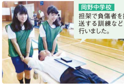
岡野中学校 担架で負傷者を搬送する訓練などを行いました。