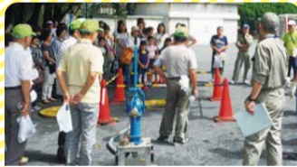
宮谷小学校 給水訓練 災害用地下給水タンクから水をくみ上げる手押しポンプの取り付けを訓練しています。